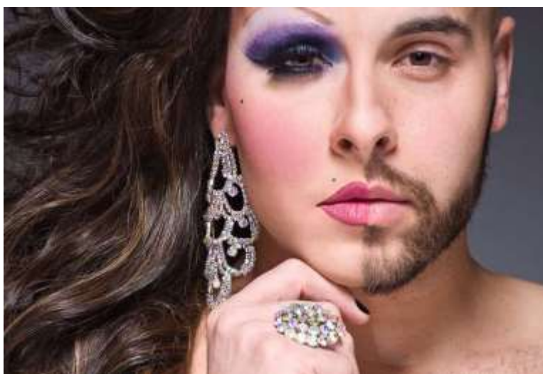
Figura 3 – Dupla Face.