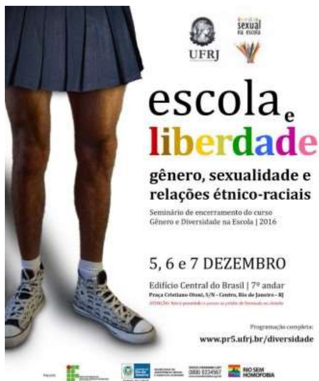
Figura 2- Liberdade.