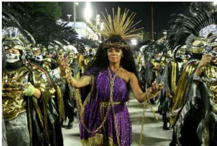
IMAGEM 2 – RAINHA DE BATERIA DA MANGUEIRA 2020.