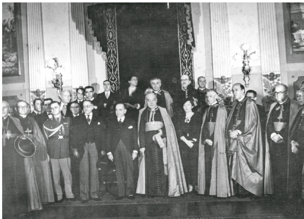
Dom Sebastião Leme, bispos católicos e Getúlio Vargas. Palácio São Joaquim (RJ), 1938.