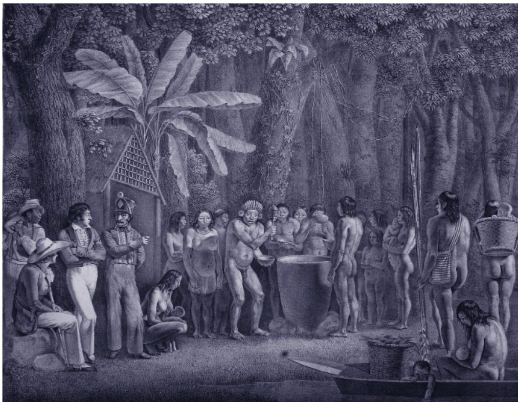
Arquivos originais da digitalização do Atlas de Viagens de Spix (1823-1831. Jornada no Brasil feita e descrita por ordem de Sr. Majestade Maximilian Joseph I Rei da Baviera nos anos de 1817-1820). Imagem em domínio público.

saliente, onde se achavam algumas esculturas pouco visíveis. Eles aproximaram-se delas respeitosos e seguindo com o dedo as figuras levemente gravadas e já quase irreconhecíveis pela erosão, exclamaram Tupã! Tupã! 19