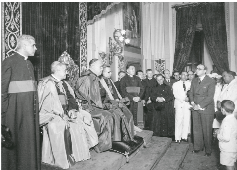
Alceu Amoroso Lima discursa para dom Sebastião Leme. Palácio São Joaquim (RJ), 1932.