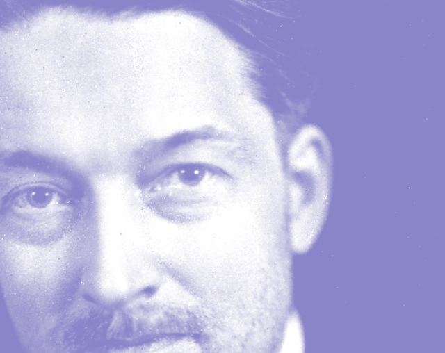
Jacques Maritain.