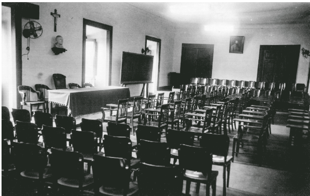
Auditório do Centro Dom Vital. Praça XV de Novembro, RJ. Circa 1930-1940.

Ode a Jackson de Figueiredo (Carlos Drummond de Andrade, Belo Horizonte, 1929) Jackson nem amigo nem inimigo, nem mesmo (o que seria cômodo) espectador [displicente na sua poltrona espionando teus gestos, tuas palavras e obras, mas distante, extraordinariamente distante [daquilo que foi a tua vida, mais distante ainda dos mundos que explo- [rastes, viajante inquieto, sem tempo para