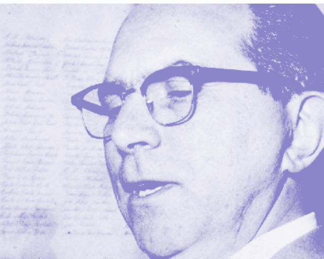
Professor Miguel Reale, dezembro de 1962.