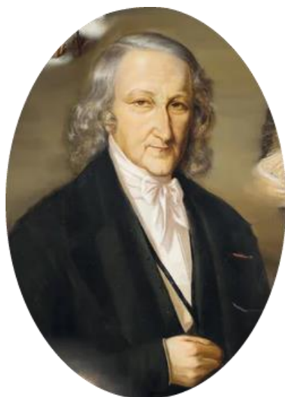
El tío banquero

Yo entonces era dueño de mi patrimonio porque había perdido de pequeño a mi madre y, algunos años después a mi padre; pero me había quedado un tío muy ilustre, el patriarca de la familia, un segundo padre, que no teniendo hijos había dado todo su cariño a los hijos de su hermano.