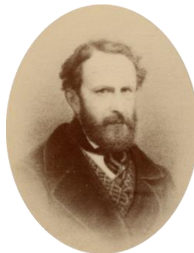
Marie-Théodore Renouard, vizconde de Bussière (18 junio 1802, Strasburgo - 21 enero 1865, castillo de Reichshoffen)

Estando allí y despidiéndome de él, murmuraba interiormente sobre la inutilidad de la visita y del tiempo perdido.