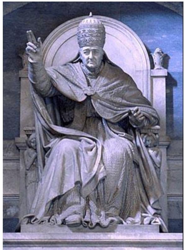
Papa Gregorio XVI que recibió a Alfonso Ratisbonne

Fue en calidad de recién nacido en la Iglesia como me presentaron al Padre de todos los fieles. Me parece que desde que fui bautizado profesaba sentimientos de respeto y de amor filial hacia el Santo Padre. Por tanto, me sentí muy feliz cuando me anunciaron que sería acompañado a la audiencia y presentado por el P. General de los Jesuitas. Sin embargo, estaba temblando porque nunca me había presentado ante los grandes de este mundo que entonces me parecían tan pequeños ante la verdadera grandeza. Confieso que las majestades de este