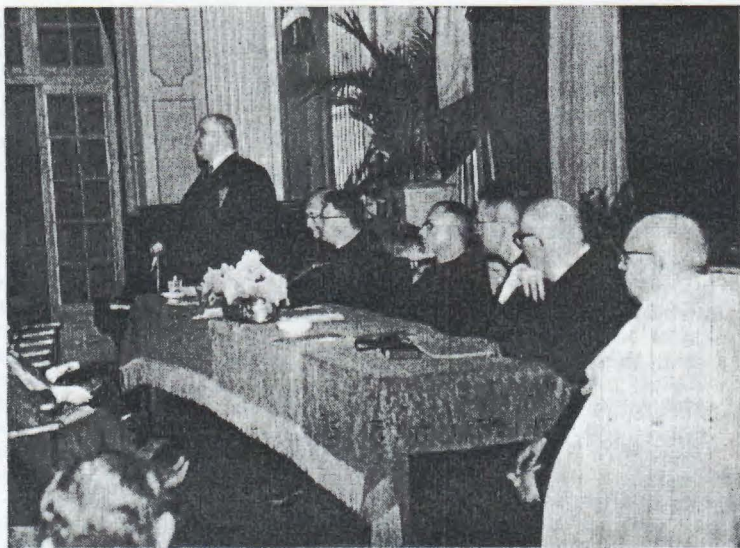
Fala o Dr. Plínio C. de Oliveira — Sessão solene do dia 15.

O enunciado da tese manifesta o louvável propósito de evitar que, em matéria de Ordem Terceira do Carmo, fiquemos apenas em exterioridades. Com efeito, o escapulário é um objeto palpável, que simboliza de um modo muito sensível nossa ligação com Nossa Senhora. Mas precisamente porque tal símbolo apresenta essas qualidades, podem certos espíritos facilmente cair na idéia de que sua simples posse, seu mero uso são suficientes para nos manter ligados a Na. Sra.. Também a profissão na Ordem Terceira do Carmo, feita habitualmente de modo tão solene e festivo, fala muito aos sentidos e à imaginação. Por isto mesmo, podem certas pessoas facilmente formar a idéia de que o simples fato da profissão estabelece entre nós e Na. Sra. um vínculo tão profundo, que basta por si mesmo, e para todo o sempre, sem mais deveres, para nos manter unidos a Nossa Senhora como perfeitos Terceiros. Tal é a condição do homem nesta terra que mesmo as melhores coisas, e as mais louváveis, são susceptíveis de abuso, não porque nelas haja qualquer coisa de mal, mas porque o mal está no homem cuja natureza decaiu com o pecado original. Assim se pode dizer que essas exterioridades tão úteis, tão oportunas, tão sábias, tão necessárias à natureza do homem podem, entretanto, ser usadas de modo errado fazendo com que tudo aquilo que o símbolo significa seja esquecido e apenas a realidade