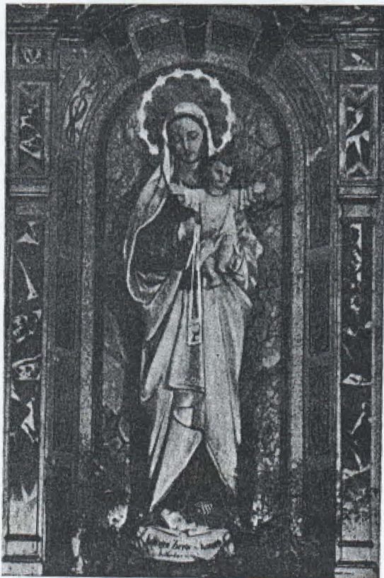
NOSSA SENHORA DO CARMO, MAE DOS CARMELITAS.

Assim, conheceremos aqui na terra o cumprimento da promessa de Nosso Senhor. “Bemaventurados os limpos de coração”.